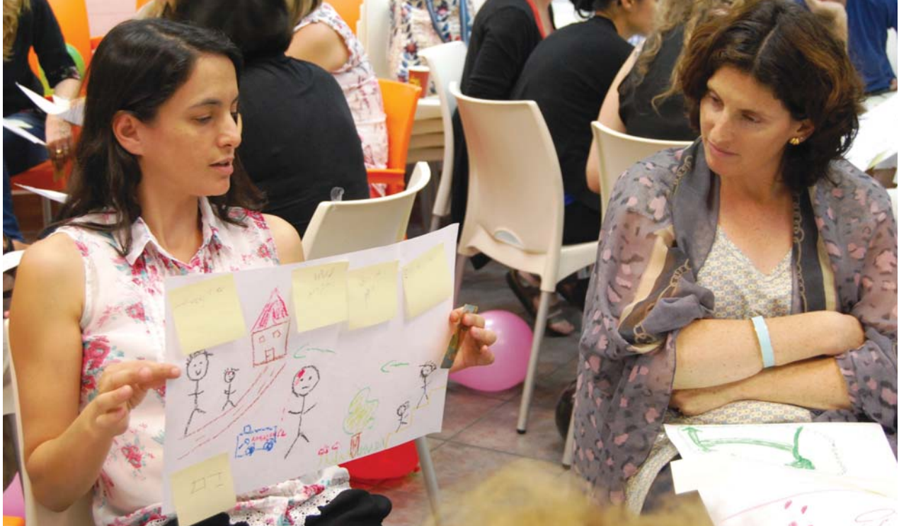
בזמן מהדורות החדשות היומיות מקרין ערוץ חדשות 2 כתובית ובה מספר הטלפון של עמך, אשר נתן מענה חירום טלפוני לניצולים בכל הארץ.