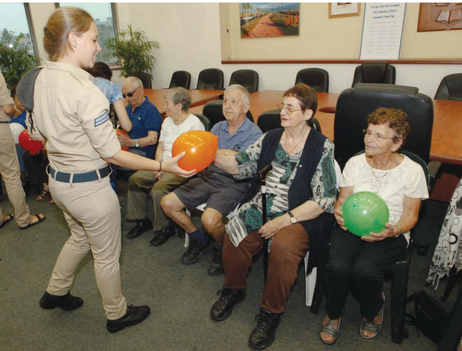
חיילות צה"ל המתנדבות חולקות רגעים של משחק עם הניצולים ברחובות.