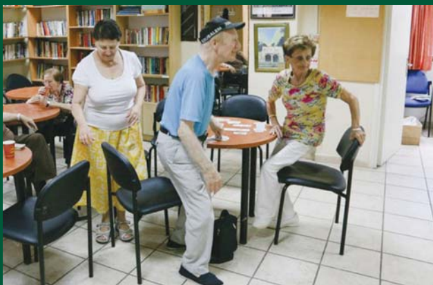
רצים לחדר המדרגות בעמך כאשר נשמעת האזעקה

"כשיש אזעקה, השוהים בסניף תל אביב מתאספים בחדר המדרגות של הבניין. עבור חלק, הדבר מעלה זיכרונות נוראים של הימלטות מהנאצים, אחרים לוקחים את זה בהומור - עברנו את היטלר"